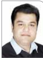
بنابراین به نظر می‌رسد برای رفع این مشکل بانک مرکزی در تعامل با دیگر نهادهای باید به سمت مولد کردن دارایی‌های دولت برود تا دولت بتواند با مدیریت هزینه‌های خود، به درآمدهای پایدار بیشتری دست پیدا کند.

این کارشناس اقتصاد و کارآفرینی در ادامه یکی از