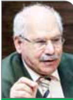
تولید در کشور ما با زحمت به ۱۰ درصد می‌رسد در حالی که این سرمایه‌گذاری در هر حوزه دیگری، بیش از این بازده خواهد داشت و در مواردی مانند حوزه خرید و فروش خودرو ۱۲۰ درصد یا حوزه مسکن حدود ۱۰۰ درصد است. این رقابت نابرابر بی‌تردید نظام اقتصادی کشور را از تعادل به سمت تورم سوق خواهد داد.

وی درباره شرایط کشور در کنترل تورم نیز عنوان کرد: ایران با در اختیار داشتن منابع، نیروی کار و انرژی ارزان، ظرفیت‌های بالایی را دارد اما