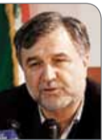
مجموعه بزرگی را مدیریت می‌کنند، این در حالی است که تعداد کل کارکنان دولت زاین

حیدری کرد زنگنه در پایان وضعیت اقتصادی کشور را ویژه دانست و خاطر نشان کرد: دولت و مجلس باید با یک بررسی علمی تلاش کنند هزینه‌ها را تا جای ممکن کاهش دهند. تنها در این صورت است که امکان کمتر شدن کسری بودجه وجود خواهد داشت. با افزایش مالیات‌ها اتفاقا که می‌افتد افزایش بیکاری و فقر خواهد بود و اتفاقاً در نهایت تورم هم کنترل نخواهد شد.