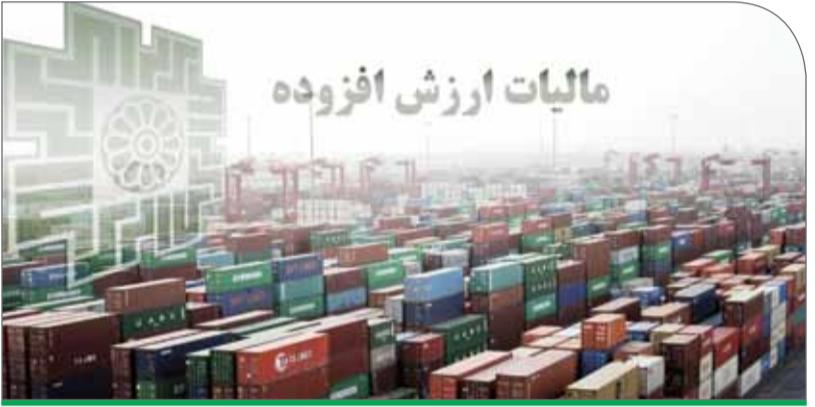
طرح: آیدآ فریدی

بررسی‌ها درباره موضوع افزایش مالیات ارزش افزوده و نقش آن در تولید، تجارت و اقتصاد کشور نشان می‌دهد که بیشتر کارشناسان و فعالان اقتصادی، نه تنها با افزایش نرخ این نوع مالیات موافق نیستند و آن را مغایر با اهداف تولیدی و شرایط اقتصادی کشور می‌دانند، بلکه حتی از شیوه اخذ این نوع مالیات به شکل کنونی نیز رضایت چندانی ندارند. این گروه معتقدند که با توجه به خلأهای اقتصادی و تجاری موجود، بسیاری از دانه‌درشت‌های مشمول مالیات، با هزار ترفند و حیل از زیر بار این مسئله شانه خالی کرده و فشار بیشتری را به سایر بخش‌های اقتصادی وارد می‌کنند. بنابراین، به نظر می‌رسد دولت و بخش‌های دست‌اندرکار در این حوزه بیش از اینکه به افزایش نرخ مالیات توجه کنند، باید اصلاح نظام مالیاتی و نحوه دریافت مالیات از بخش‌های مختلف اقتصادی را مورد توجه قرار دهند که چه بسا با حل این مشکلات، حجم مالیات دریافتی را همین‌ترخ موجود پوشش‌دهنده بخش زیادی از نیازهای مالی دولت برای بودجه ریزی باشد.