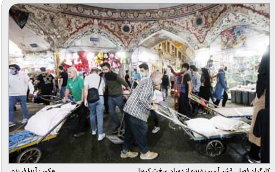
کارگران فصلی قشر آسیب دیده از دوران سخت کرونا