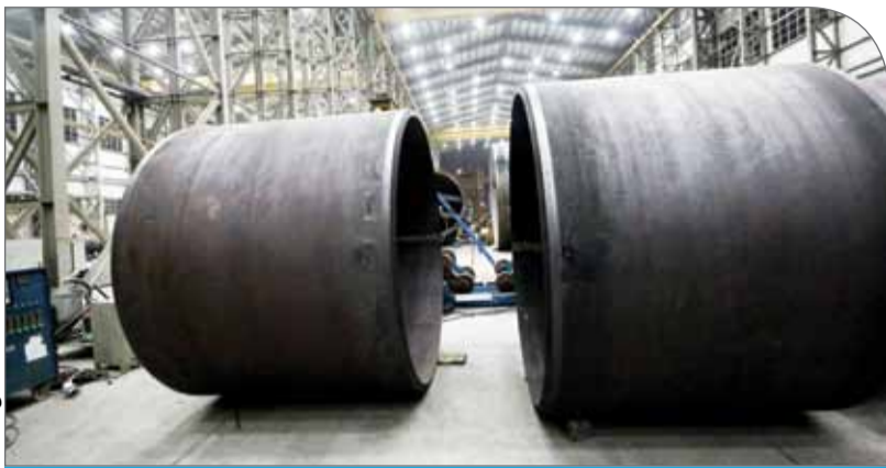
بحث تامین مواد اولیه صنایع پایین‌دستی چند سال است که گریبان همه تولیدکنندگان بخش خصوصی را گرفته است

حذف واسطه‌گری و حضور دلالان در حلقه‌های مختلف زنجیره تولید از اهمیت ویژه‌ای برخوردار است، چراکه این حذف زمینه کمبود مواد اولیه و رشد قیمت آن را فراهم می‌کند. بنابراین باید روند معاملات را به‌گونه‌ای ترتیب داد که از یک‌سوی شفافیت در معاملات افزایش یابد و از سوی دیگر، خریداران غیر واقعی از این معاملات حذف شوند.