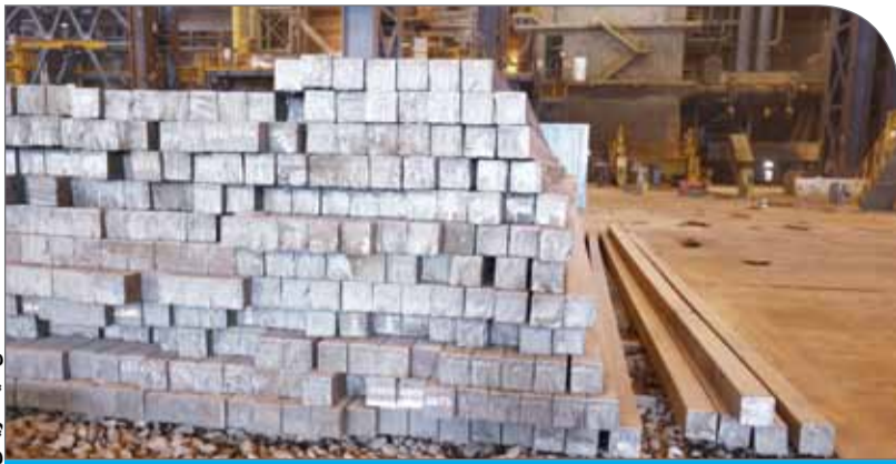
تولید فولاد در کارخانه

ابطال معاملات به‌ویژه در محصولات میانی مانند شمش، رویه‌ای همه سر باخت است، چه برای کارخانه مصرف‌کننده که امکان تامین مواد اولیه‌اش را از دست می‌دهد، چه برای کارخانه عرضه‌کننده که برنامهریزی تولید و نقدینگی و فروش آن بر هم می‌خورد